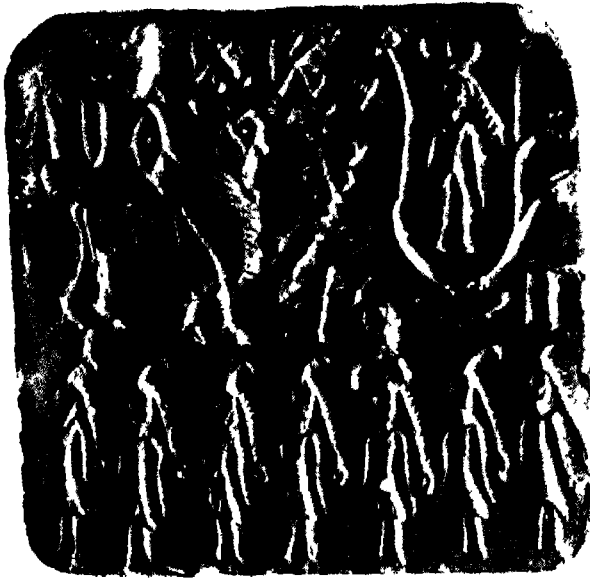
SINDH FIVE THOUSAND YEARS AGO

‘मोहनजोदड़ो के उत्खनन से प्राप्त भगवान् वृषभदेव विपद्यक एक महदेवपूरा मुद्रा । वृषभनाथ द्विगम्बर (नग्य) एवं छ्याममूद्रा में योगमय है । शिर पर त्रिशूल रत्नत्रय का प्रतीक चिह्न प्रकृत है । मधुवासी का प्रतीक कोमलमता का एक पता मुख के पास है । फलपूक्त कल्पवृक्ष-परिवेष्टित तीर्थंकर वृषभदेव भक्त को भक्ति के अनुसार फल पढ़ाता का प्रतीक है । भक्ति से करबद्ध पार्थना नमस्कार निवेदन करते हुए चक्रवर्ती भरत महाराज और उनके पीछे भगवान् का चरणा-चिह्न बिल खड़ा है । नीचे की पंक्ति में भरत सम्राट् के सप्ताग प्रतीक (१ राजा, २ ग्रामाधिपति, ३ जनपद, ४ द्वागं ५ भराडार, ६ षडगवाल ७ मित्र) श्रेणीबद्ध रखे हैं ।’